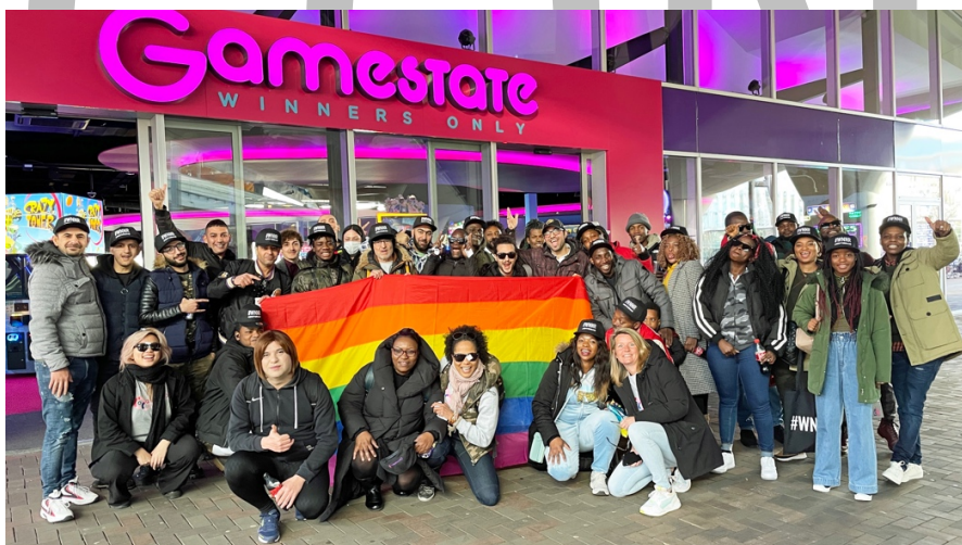
3De Cocktail-groep tijdens hun event bij Gamestate.

Cocktail richt zich op de empowerment van LHBTIQ+ vluchtelingen en het doorbreken van hun isolement door maandelijks een event te organiseren. De Facebook-community kent inmiddels ca. 1,2 duizend LHBTIQ+ nieuwkomers. Aangezien het jaar begon in een lockdown heeft het Cocktail-team maandelijks een online event georganiseerd zoals een pub quiz en een kickboxing workshop. Toen fysieke evenementen weer konden plaatsvinden heeft het team onder andere een Classical Concert Night en een bezoek aan het Anne Frank Museum georganiseerd. Ook was Cocktail weer aanwezig bij COC's Shakespeare Club en de Pride Walk. Het jaar werd feestelijk afgesloten met een geweldig eindejaar-evenement, namelijk een boottocht in het kader van het Amsterdam Light Festival.