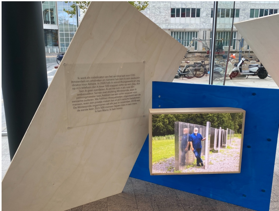
2 Een stelling in de nieuwe bibliotheek in Almere Stad van de expositie "Extremely Normal"