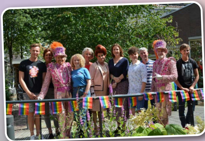
De Rietvinck Senior & Youth Pride, 2019

Vreugdehof Inspiratiebijeenkomst Senior Pride, 2022