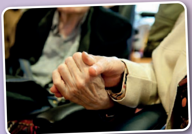
Bernardus Nationale Coming-outdag, 2009

"Op mijn werk is het heerlijk om open te kunnen zijn over wie ik ben, mijn zoektocht, mijn onzekerheden en drijfveren. Daarmee help ik anderen om open te zijn