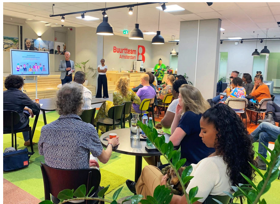
COC Veiligheid bij Buurtteam Amsterdam

In 2022 organiseerde COC Amsterdam e.o. bijeenkomsten met andere partners over veiligheid in twee stadsdelen, namelijk Oost en Zuid-Oost. Ook was er een bijeenkomst in Amsterdam Noord. Er werden in 2022 vijftien LHBTIQ+'ers ondersteund die te maken hebben gehad met agressie/ discriminatie in hun woonomgeving of in openbare ruimten. Verder werden in oktober weerbaarheidstrainingen gegeven en was COC Amsterdam e.o. in april en oktober vertegenwoordigd in de regenboogveiligheidsalliantie van de gemeente Amsterdam.