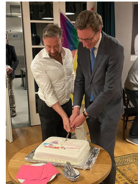
COC in Amstelveen

De activiteiten bij Amstelveen Sport zijn weer gestart. Vele activiteiten bijgewoond zoals een gesprek rondom de Roze Loper bij Stichting Brantano, een conferentie over regenboogsteden en de Werkgroep Diversiteit. Het Regenboognetwerk met meerdere zorginstellingen bijgewoond over het jezelf kunnen zijn in de zorg met een veilige omgeving.